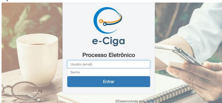
Figura 03: Sistema de Processo Eletrônico.

Sistema de processo eletrônico administrativo - e-CIGA: houve a cessão, pelo Tribunal de Contas do Distrito Federal, ao CIGA do Sistema de Protocolo e Acompanhamento Processual Eletrônico, também conhecido como e-TCDF. O referido sistema, desenvolvido por técnicos do próprio Tribunal de Contas do Distrito Federal, permite a gestão de processos e documentos, desde a autuação, até o arquivamento.